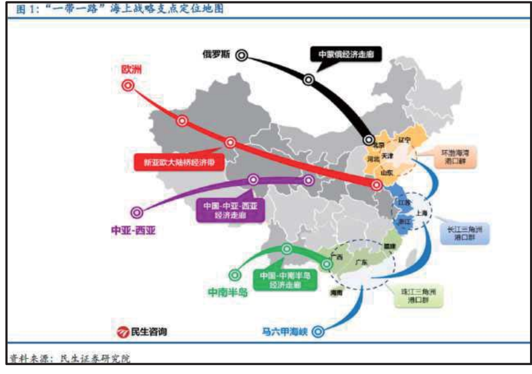
<그림 3> 일대일로 6대 회랑

출처: http://www.cnrepark.com/news/2015-05/20150528_96099.shtml (2016.10.22. 방문)