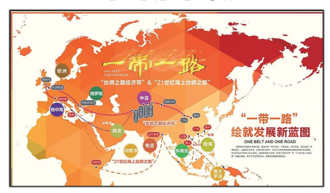
<그림 2> 일대일로 발전 청사진

상대적으로 낙후되었으나 커다란 발전 잠재력을 가지고 있는 국가이다. "오선(5线)"은 중국이 계획한 5개의 발전노선으로, 그 중 실크로드경제벨트에 3개 노선이 포함된다. 소통의 중심인 중국은 중앙아시아와 러시아를 거쳐 유럽(발트해)까지 이른다. 중국은 중앙아시아, 서아시아를 거쳐 페르시아만과 지중해에 이른다. 중국은 동남아시아, 남아시아, 인도양까지 이른다. 21세기 실크로드의 두 길의 중점방향은 중국 연해항구에서 출발하여 남해를 거쳐 인도양에 이르고 유럽까지 연장되고, 중국 연해 항구에서 남해를 거쳐 남태평양에 이른다.