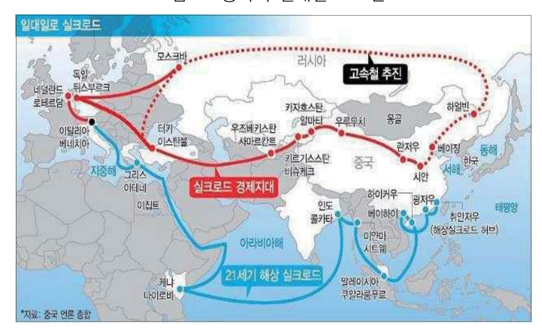
<그림 1> 중국의 일대일로 노선도

해상운송 대로이다. 해상의 협력 네트워크는 항구 및 기타 연해 인프라 건설을 포함하고 있고, 중점 방향은 중국 연해 항구-남해-인도양 유럽에 이르는 노선과 중국 연해 항구-남해-남태평양에 이르는 노선을 말한다. 이는 동남아시아 국가연합과 아시아를 연결하고 동아프리카와 지중해 북부의 경제 협력지역까지 연장하는 것으로, 협력을 통한 Win-Win 및 상호 이익의 경제벨트를 통해 개방성과 포용성을 갖게하는 것이다.