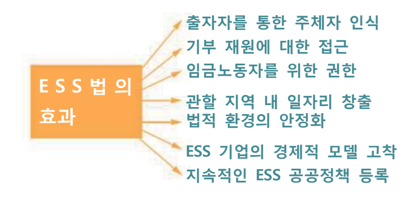
<그림 4 - ESS법(안)의 기대효과>

사실 이러한 법률안과 무관하게, 현재 프랑스의 사회연대경제는 20만 개 기구, 즉, 협회, 협동조합, 상호부조, 기금 및 사회적기업에서 8분의 1이 민간기업으로서 이미 임금노동자가 240만 명에 달한다. 최근 10여 년간 전통적 경제 하에서 새로운 일자리 비율이 7%인데 반해 사회연대경제 하에서는 23%의 새로운 일자리를 마련하였다. 따라서 현재부터 2020년까지 은퇴로 인해 퇴직을 이유로 하는 새로 갱신될 일자리는 60만 개가 될 것으로 기대하고 있으며,54)모든 경제주체가 이 분야에서 현재의 경제상황과 재정적 위기에 대처하고 시금석을 마련하는 것에 동의하고 있다.55) "사회연대경제" 법률안, 소위 ESS법안은 잠재적 경제 분야를 발전시키면서 고용을 위한 정부의 개선 노력에 기여할 것으로 기대되고 있다.56)