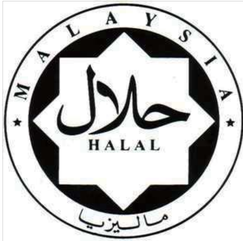
<그림-2: 말레이시아 할랄 로고>