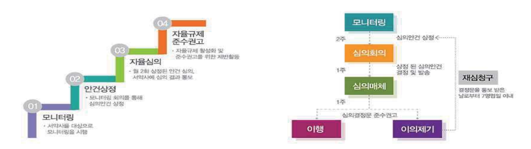
[그림 3] 인터넷신문위원회 광고심의 절차 및 주기150)

등에 관한 규정을 두고 있으며, 이에 대한 세부 자율심의규정으로 「인터넷신문광고 자율규약 시행세칙」을 두고 있다.