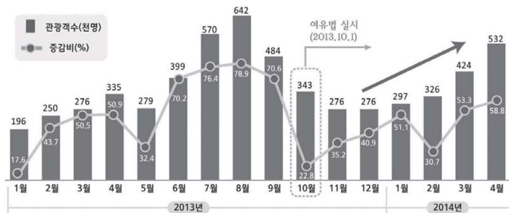
【한국방문 중국인 관광객 동향 75) 】

최근 이러한 문제점에 대하여 앞에서 소개한 중국 여유법 시행을 통하여 우리나라에서도 중국인 관광객의 감소와 해당 관련 업체의 손실과 이에 대한 대응방안을 모색하고자 하는 노력이 있었다. 다행히도 아래의 표에서 보여 지는 바와 같이 그 여파는 크지 않은 것으로 판단할 수 있겠으나 향후 이에 대한 보다 적극적인 해소 방안을 검토해야 할 것이다.