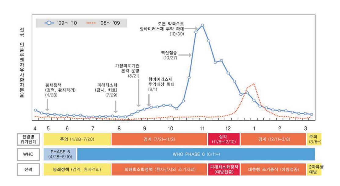
<환자발생 추이에 따른 국가대응전략>3)

고 대응하였으나, 그럼에도 불구하고 지역사회 감염 사례가 확인되고학교 등에서 유행이 발생함에 따라 선제적 항바이러스제 투여와 예방접종 등의 '피해최소화 정책'을 통해 사망을 예방하고 사회기능을 유지하는데 초점을 두었다.