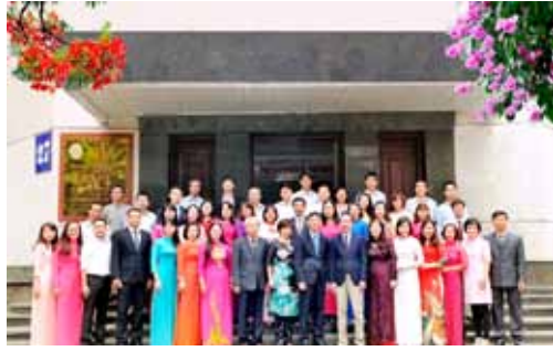
연구소 개소 50주년 기념식 Researchers celebrating 50th year of ISL Establishment