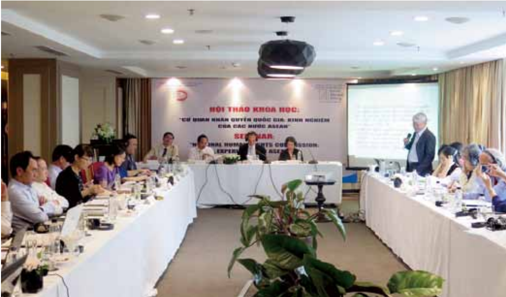
국가 인권 기구 워크숍

Workshop on National Human Rights Institutions