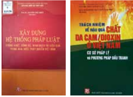
법제연구 관련 최신 간행물 Recent publications on legislative study

제공했습니다. 연구소는 경쟁 및 소비자 보호에 대한 법적 연구에 착수했습니다. 그리고 곧 법을 사회학 및 비교법 연구의 필요성을 인식하게 되었습니다. 연구소의 연구는 베트남 정치 체제에 관한 이론적·법률적 문제에 더 많은 비중을 둡니다. 2001년 개헌 및 2013년 헌법 시행 시 헌법 초안 작성 기관은 법치 국가의 조직과 운영에 관한 연구소의 연구 결과를 기준으로 삼았을 뿐만 아니라 상당히 반영했습니다. 연구소는 또한 베트남의 국가 기구, 행정부 및 사법 개혁을 위한 과학적 근거를 제공하고 있으며, 입법 전략, 이론적·실질적 근거 그리고 관련 내용을 제안한 선구자입니다. 사법부의 중심에 법원을 배치하도록 최초로 제안했으며, 그 결과 사법 개혁은 조직 및 운영 측면에서 인민법원의 개혁과 함께 진행될 수 있었습니다.