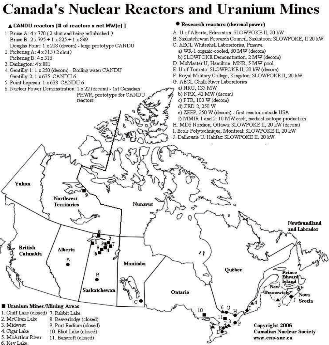
<그림1> 캐나다 원자력발전소 및 우라늄 광산 위치